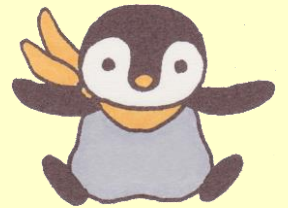
らしーくマスコット らっしー